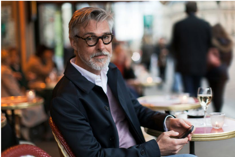
Lenti ZEISS sottili e leggere

Chi indossa le lenti progressive , caratterizzate da un'invisibile linea di transizione fra le diverse aree visive del vicino e del lontano, può godere di ottime performance visive con una lente in alto indice. Indipendentemente dal potere correttivo necessario, le lenti in alto indice consentono una visione di qualità e un ottimo risultato estetico, perfetto per un occhiale alla moda.