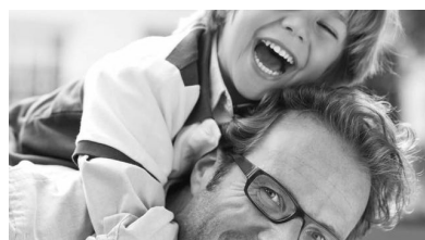
Trattamenti DuraVision Premium